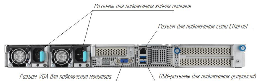
Рисунок 1 – Подключение сервера (расположение, внешний вид, типы разъемов и их количество может отличаться от приведенного)

9.9. СПО «Синергет КСБО» защищается программным ключом.